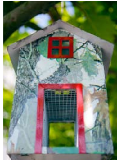
Aan een van de dakplatanen hangt een leuk vogelvoederhuisje.