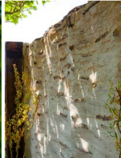
De schutting is gemaakt van gevlochten wilgentenen en leem.