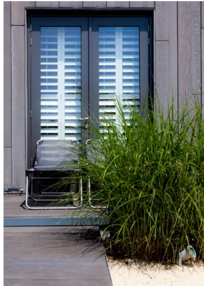
Vlonders, half verharding van gravier d'or en een pol Japans prachtriet (Miscanthus): het past helemaal bij de gewenste strandsfeer net zoals de ligbedjes en de shutters voor het raam.