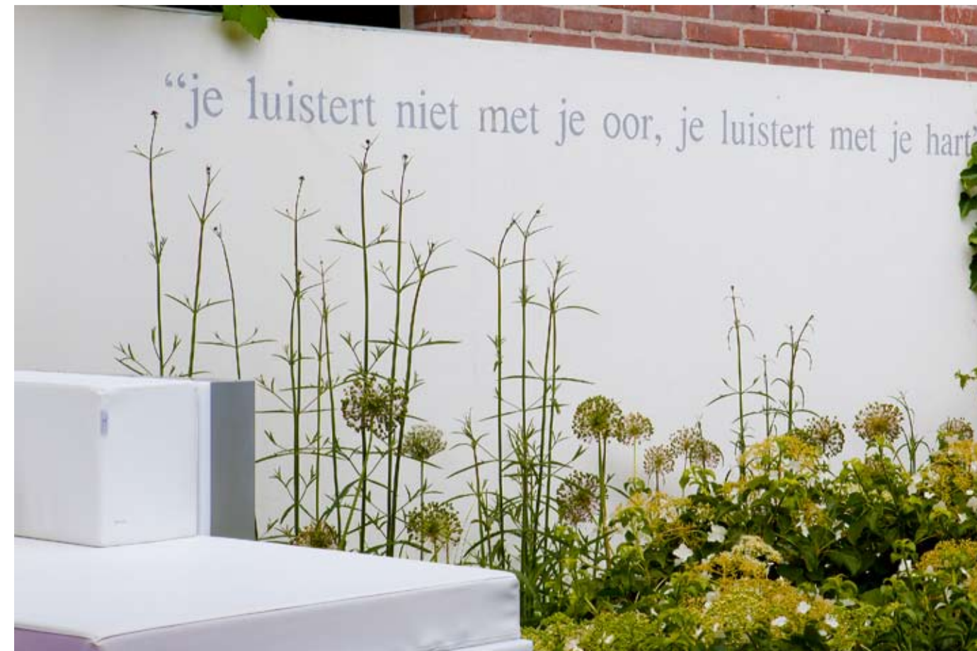
De plantensilhouetten steken mooi af tegen de witgestuukte muur.