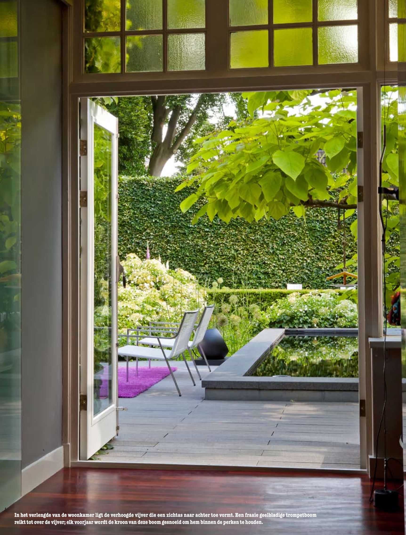
In het verlengde van de woonkamer ligt de verhoogde vijver die een zichtas naar achter toe vormt. Een fraaie geelbladige trompetboom reikt tot over de vijver; elk voorjaar wordt de kroon van deze boom gesnoeid om hem binnen de perken te houden.