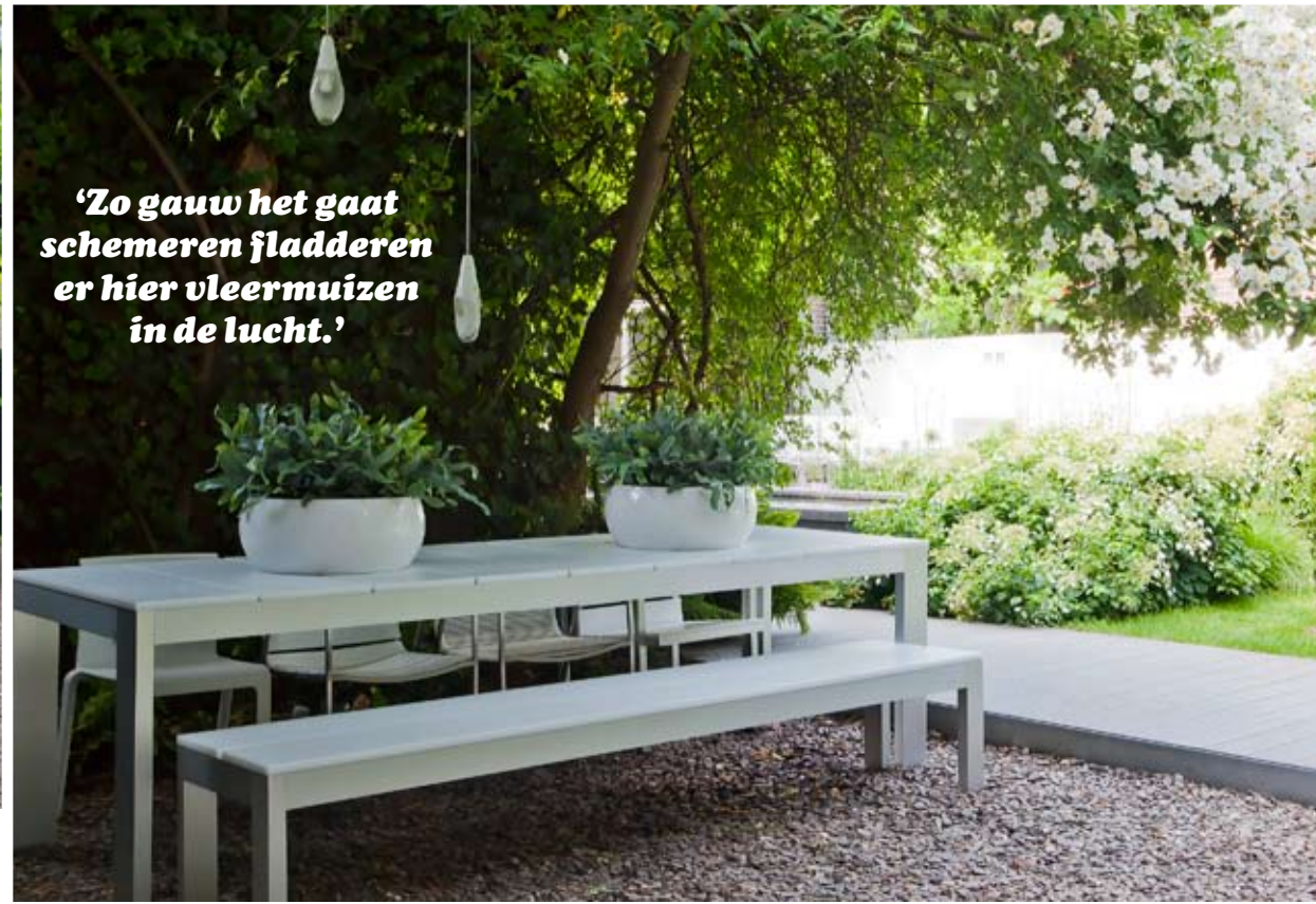
'Zo gauw het gaat schemeren fladderen er hier vleermuizen in de lucht.'