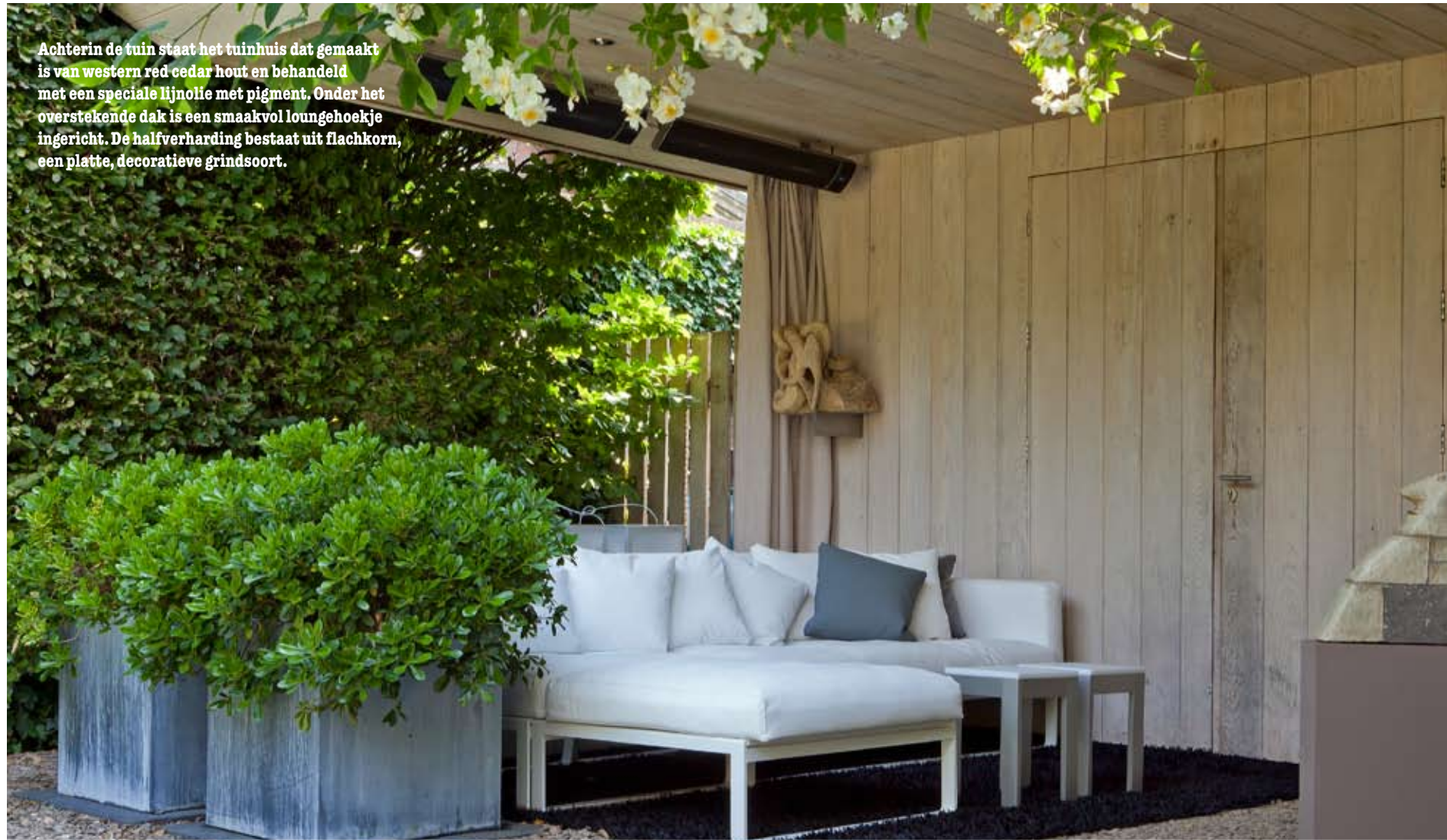
Achterin de tuin staat het tuinhuis dat gemaakt is van western red cedar hout en behandeld met een speciale lijnolie met pigment. Onder het overstekende dak is een smaakvol loungehoekje ingericht. De halfverharding bestaat uit flachkorn, een platte, decoratieve grindsoort.