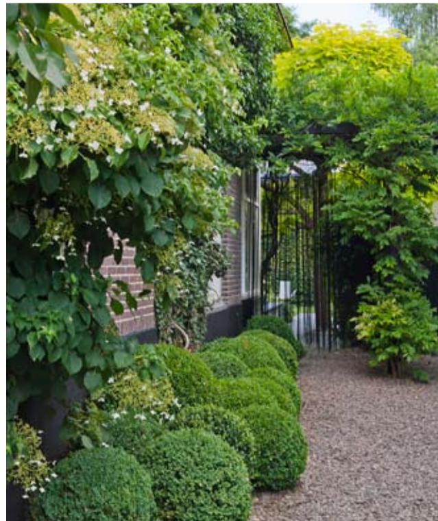
Pierre van de Heiden past liever 'niet te veel' materialen in een tuin toe. Aan de zijkant beperkt hij zich tot flachkorn als halfverharding en een buxuswolk langs de gevel.