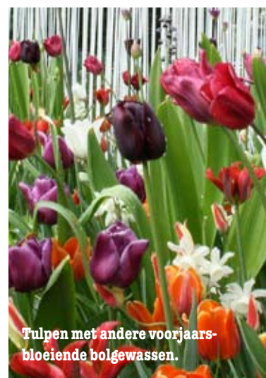
Tulpen met andere voorjaars-bloeiende bolgewassen.